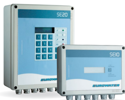
Sterowniki SE10 i SE20.

Każde urządzenie posiada dostosowane sterowanie PLC. Nasze sterowniki są wykonane i zaprogramowane indywidualnie, przez naszych inżynierów, którzy stale je udoskonalają. Prosty panel ułatwia sprawdzenie konfiguracji parametrów, oraz kontrolę pracy i regeneracji stacji. Szczegóły w osobnych materiałach informacyjnych.