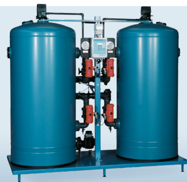
SMH/SMP Flöde upp till 30 m 3 /h