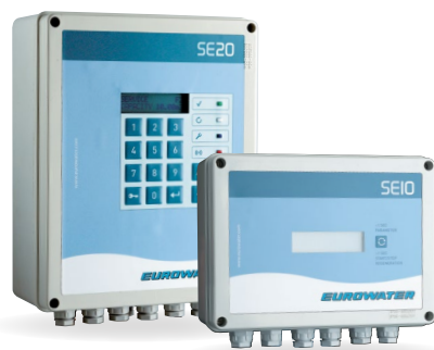
SE10 och SE20 styrpanel.

Det enkla gränssnittet underlättar konfigurationsparametrar, driftkontroll och regeneration. Se separat broschyr.