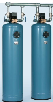
SF/SFG Flöde upp till 9 m 3 /h