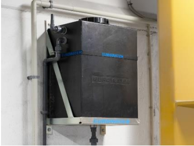
Vandtank på 50 liter, højt placeret.

Vandet fra SILEX anlægget opbevares i 50 liters tank, som er udstyret med niveaustyring til start/stop og overløbssikring.