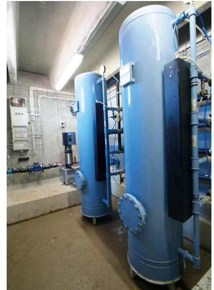
Un grand nombre de consommateurs n'ont pas accès à une station de traitement. La solution technique alors proposée sera la même que pour les fournisseurs d'eau. Un filtre à pression NSB est l'idéal pour les petits fournisseurs d'eau.

Avec une filtration primaire puis secondaire, l'eau est oxydée et filtrée deux fois. Cette méthode est utilisée lorsqu'un seul filtre est insuffisant pour atteindre la qualité demandée.