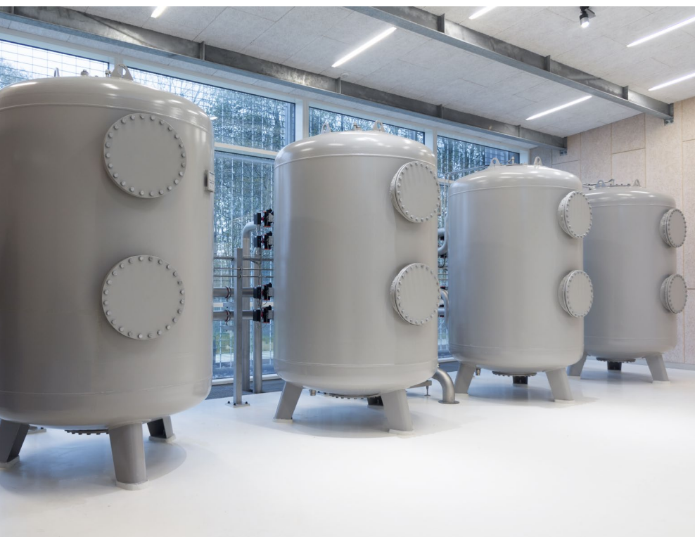
Suppression du fer, du manganèse et de l'ammonium en station de distribution. Débit maxi: 2 x 30 m 3 /h.