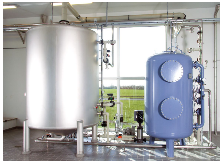
Le dégazage des gaz dissous comme le dioxyde de carbone, le méthane et l'hydrogène sulfuré est indispensable pour un traitement optimal. Photo : dégazage et filtration pour une brasserie.