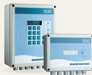
Coffrets SE10 et SE20

Tous les coffrets sont adaptables aux besoins spécifiques des industriels et traiteurs d'eau. Nous offrons une large gamme de coffrets de contrôle – du simple programmeur à l'automate combinant le contrôle, la régulation, le monitoring ainsi que la gestion par GSM ou internet.